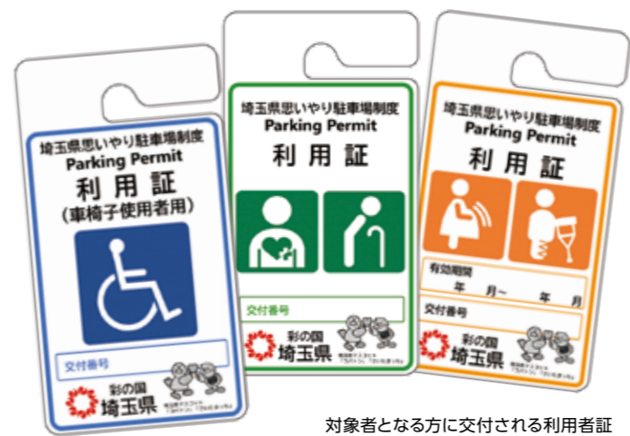
対象者となる方に交付される利用者証