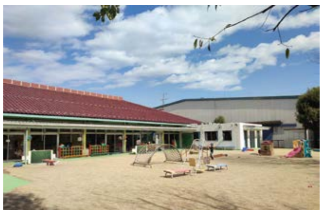
地域の中核的支援機関であるあすなる学園

議員 カンガルー通園は親子の関係づくりの場としての役割があるが、カンガルー通園に通っていた保護者からは、子育ての悩みや発達の相談にもっと積極的に乗って欲しいとの要望の声がある。また、地域の中核的な支援機関である「あすなる学園」への期待は高く、高い専門性を有する臨床心理士などの専門職を配置するなどして、時代に合った質の高い療育や、「早期発見・早期療育」を求め保護者のニーズも十分に伝える支援を要望する。