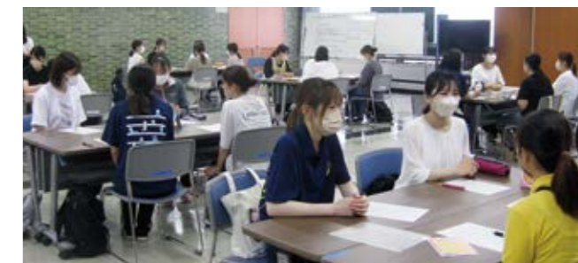
保育士の質をあげるための研修

こども健やか部長 ①国、県及び近隣自治体の動向等を注視する②県への要望を検討する③公民連携事業を積極的に展開し、保育の質の向上や、保育の魅力アップの事業など、実効性のある取り組みを継続的に実施する。