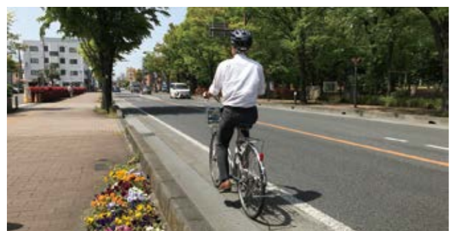
自転車ヘルメットの着用が努力義務化されました

A 子供運転免許教室、出前講座などで啓発活動を実施している。「横断者注意喚起灯」は、他自治体の設置状況や効果、コストなどについて調査研究していく。